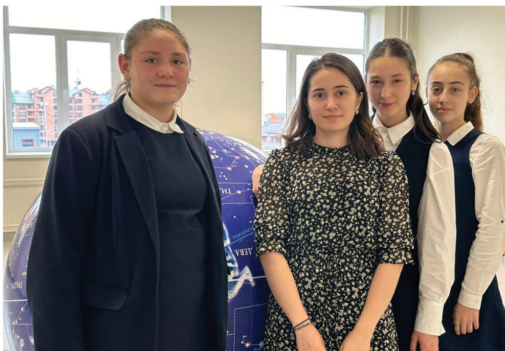
2023-й объявлен Годом педагога и наставника. Президент России Владимир Путин отметил: «Смысл Года педагога и наставника в том, чтобы привлечь внимание к труду людей, которые отдают время и силы детям, молодежи, нашему будущему, рассказывать о том колоссальном вкладе, который вносят учителя, наставники в успех и достижения всей страны».

Профессия учителя всегда остается самой почетной, но в то же время и самой трудной. Ведь умение передать свой опыт молодому поколению, только вступающему в самостоятельную и трудную жизнь – это талант. Наша героиня – учитель математики. А ведь математика – это язык, на котором написана книга природы. Это основа и опора всех наук. Отучившись в педагогическом вузе и начав делать свои первые шаги в педагогике, черствые и бездушные уходят, остаются только те, кто жить не может без доверчивых, пытливых глаз, без школьной суеты и шума, без таких привычных и очень простых слов: «Здравствуйте, дети! А сейчас у нас будет урок...» Сегодняшняя наша героиня – учительница