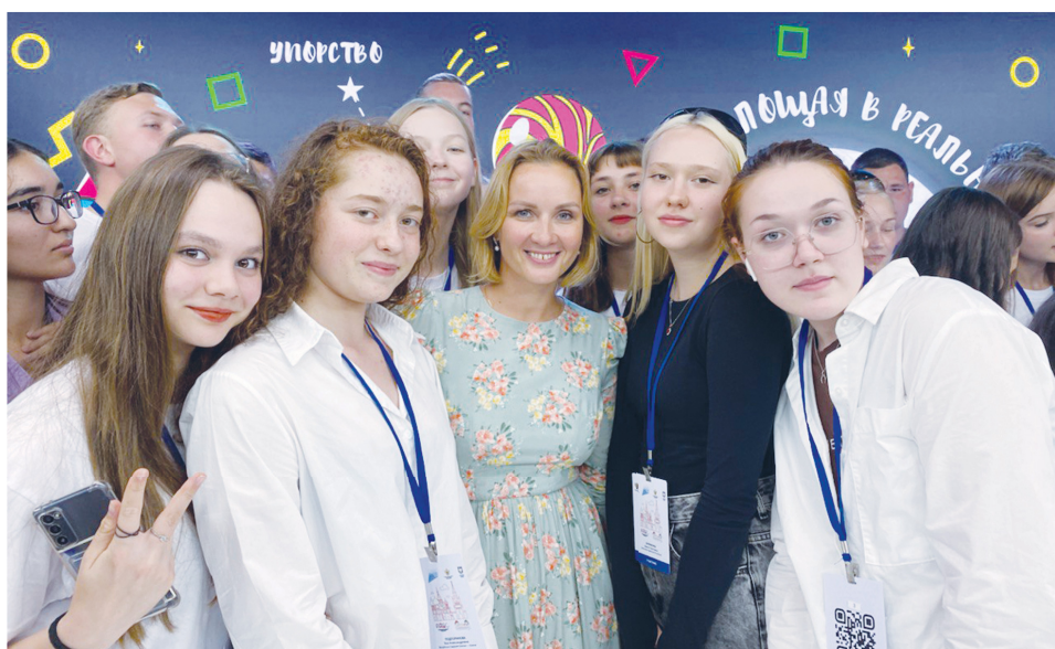
Фото с представителями других регионов и Уполномоченным по Правам Ребенка при Президенте РФ - Марией Алексеевной Львовой-Беловой