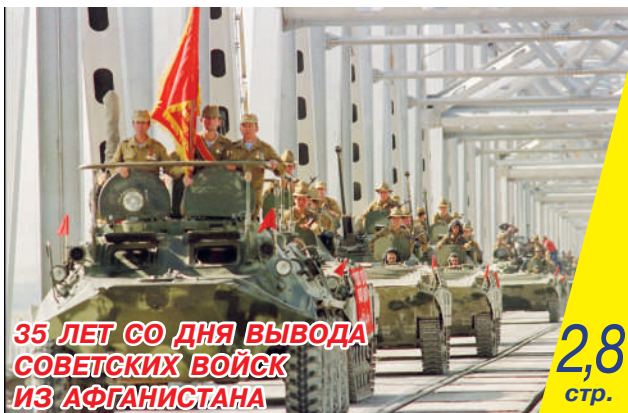
35 ЛЕТ СО ДНЯ ВЫВОДА СОВЕТСКИХ ВОЙСК ИЗ АФГАНИСТАНА