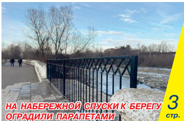
НА НАБЕРЕЖНОЙ СПУСКИ К БЕРЕГУ ОГРАДИЛИ ПАРАПЕТАМИ