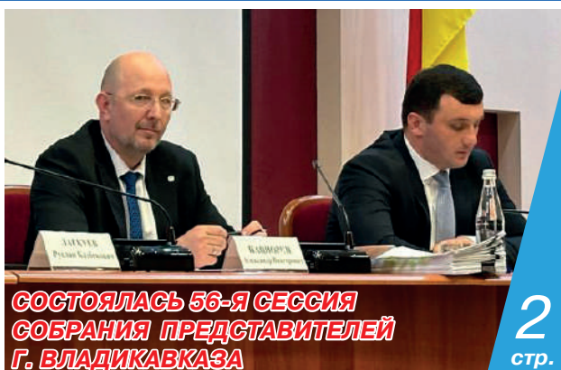
СОСТОЯЛАСЬ 56-Я СЕССИЯ СОБРАНИЯ ПРЕДСТАВИТЕЛЕЙ Г. ВЛАДИКАВКАЗА